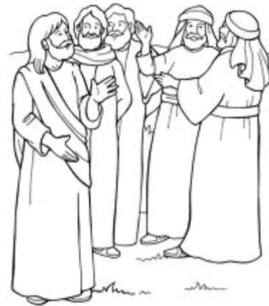
Jesus' First Followers John 1