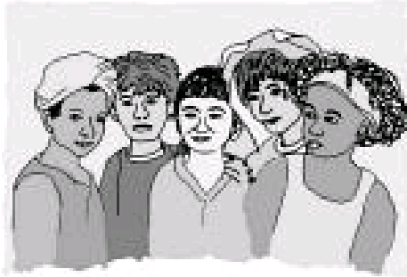
Priggiati - illustrazione del santissimo rosario - Edito con il permesso dell'editore