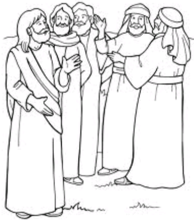
Jesus' First Followers John 1